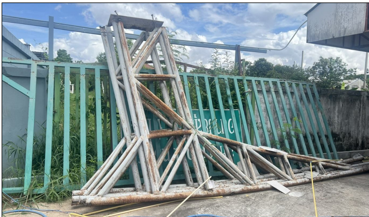
โครงเหล็กและวัสดุที่เกิดจากการรื้อถอน

คณะกรรมการดำเนินการสหกรณ์ออมทรัพย์อานามย์สุนทรินทร์ จำกัด ชุดที่ 57 ครั้งที่ 7 วันที่ 3 มิถุนายน 2569 มีมติเป็นเอกฉันท์ เพื่อเสนอที่ประชุมใหญ่วิสามัญ พ.ศ.2569 พิจารณาสร้างโรงจอดรถทดแทนที่รื้อถอนเพื่อสร้างสำนักงานสมาคมฌาปนกิจสงเคราะห์ฯ เนื่องจากมีโครงเหล็กและวัสดุที่สามารถใช้ได้จากการรื้อถอนโรงจอดรถเก่า โดยให้อยู่ภายใต้งบประมาณที่ได้รับอนุมัติจากที่ประชุมใหญ่ พ.ศ.2568 เมื่อวันที่ 21 ธันวาคม พ.ศ.2568