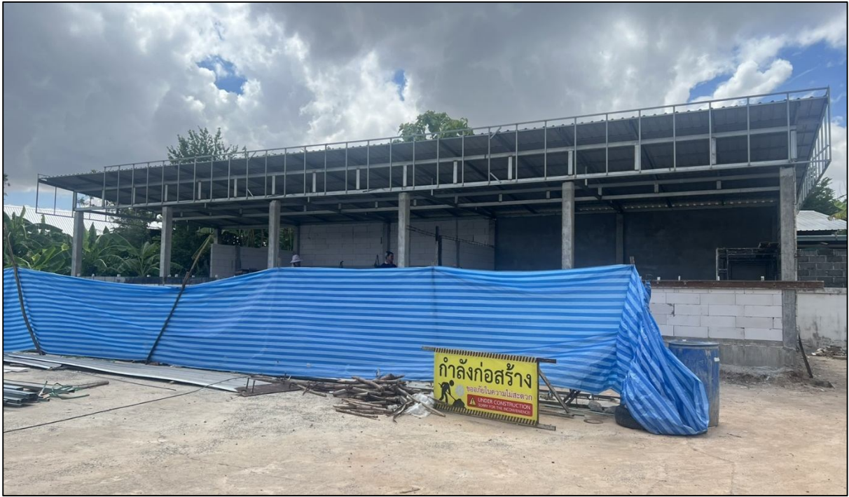
อาคารสำนักงานสมาคมฯ ปกีสงเคราะห์ที่กำลังดำเนินการ